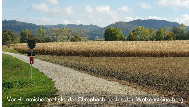
Vor Hemmishofen, links der Chroobach, rechts der Wolkensteinerberg

Radolfzell, eine sehenswerte Stadt am Bodensee mit einer langen Geschichte. Gerade wurde 850 Jahre Radolfzell gefeiert. Ziemlich bequem ist die Velotour ab Schaffhausen entlang dem Rhein über