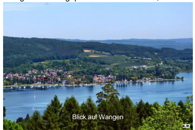
Blick auf Wangen

Nach dem Frühstück um 11:30 h per Schiff über Iznang nach Mannenbach und per Velo über Berlingen – Steckborn – Mammern – Eschenz – Stein am Rhein – Rheinklingen – Diessenhofen – Schaarenwald – Langwiesen – bis Schaffhausen (ca. 40 km) Gepäckannahme beim „Paradiesli“