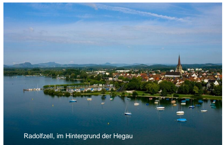
Radolfzell, im Hintergrund der Hegau