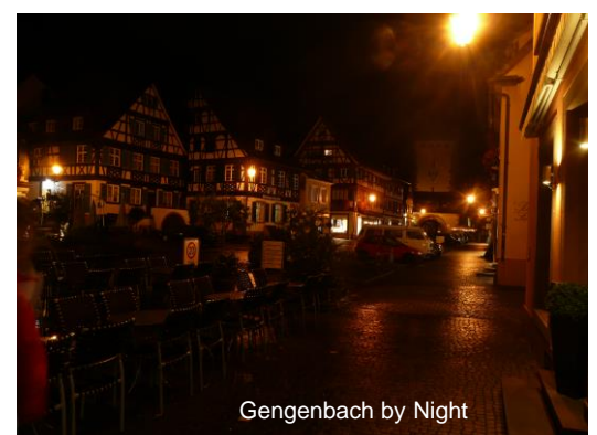
Gengenbach by Night

(sämtliche Bilder sind von der Rekognoszierungsfahrt vom 6.10.2009)