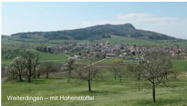
Weiterdingen – mit Hohenstoffel