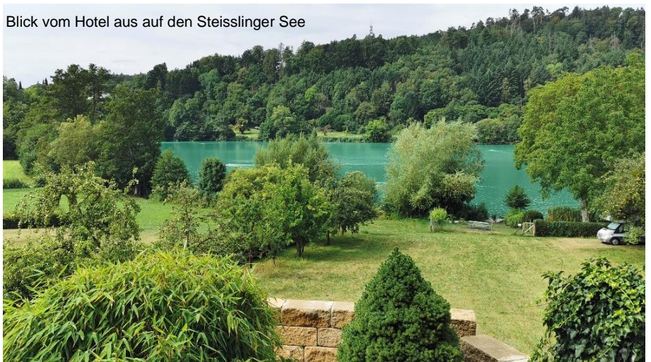
Blick vom Hotel aus auf den Steisslinger See